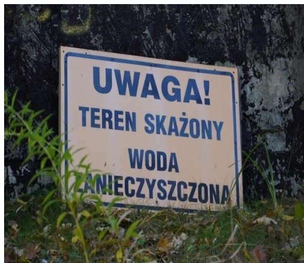
Zakłady Chemiczne „Organika-Azot” – problem odpadów niebezpiecznych w Jaworznie

Il primo incontro si è svolto il 22 ottobre 2021, durante il 4° workshop tematico regionale del progetto LINDANET. Durante il workshop si è svolta una visita in loco dove è stato illustrato il problema della contaminazione da HCH a Jaworzno. Sono state visitate le aree contaminate nei dintorni dell'impianto chimico Organika-Azot (SA) nella valle del torrente Wąwolnica, la quale affluisce nel fiume Przemsza, che a sua volta si collega con il fiume Vistola sfociante nel Mar Baltico. Ulteri informazioni