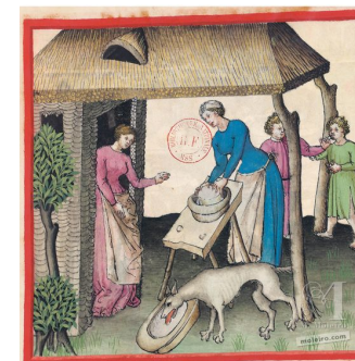
Tacuinum Sanitatis c. 58r, Formaggio