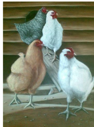
"Galline", di Laura Sel – Monfalcone (GO)