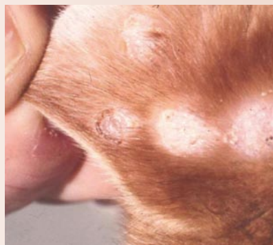
Lesioni cutanee da CPXV sull'orecchio di gatto

Le lesioni compaiono su orecchie, muso, bocca, mammelle, dita e polpastrelli; in genere non provocano prurito e guariscono spontaneamente in circa 6-8 settimane.