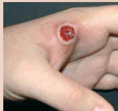
Lesione ulcerosa su mano di uomo

Le lesioni sono localizzate su collo e spalle nel caso di contagio da fancy rat , oppure su viso e mani quando il contatto è con il gatto o altri animali; in genere non provocano prurito e guariscono spontaneamente. In alcuni casi possono manifestarsi anche sintomi similinfluenzali e aumento di volume dei linfonodi.