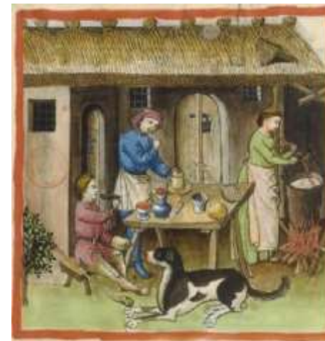
"Making White Cheese with dog" Tacuinum Sanitatis (1370-1400)